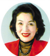
司会 林田 スマさん

1957年滋賀県生まれ。79年「11PM」で司会者としてデビュー。俳優として「マルサの女」「悲しい色やねん」「夜逃げ屋本舗2」などの映画に出演。05年には夫で俳優の船越英一郎氏と夫婦揃って「ベストファミリーマン&ワイフ」1位を受賞。芸能界一の“お掃除名人”としても注目を浴び、独自の掃除術・整理術は必聴。著書に大手ゼネコンを相手取り、欠陥住宅を修復した奮闘記「欠陥マンション、わが闘争日記」など。