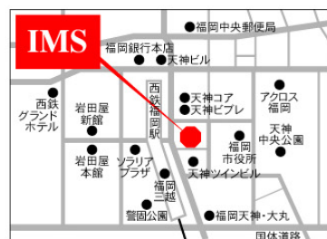
天神イムズ 福岡市中央区天神1-7-11

主催 / 住宅情報プラザ福岡(福岡県、福岡市、住宅金融公庫福岡支店、独立行政法人都市再生機構九州支社、福岡県住宅供給公社、福岡市住宅供給公社、財団法人福岡県建築住宅センター) 後援 / 国土交通省、NHK福岡放送局、九州朝日放送、RKB毎日放送、株式会社テレビ西日本、TVQ九州放送、TBS福岡放送、西日本新聞社、読売新聞西日本社、朝日新聞社、毎日新聞社、株式会社フジテレビ住宅新聞社、(株)日本住宅新聞社、西日本リビング新聞社