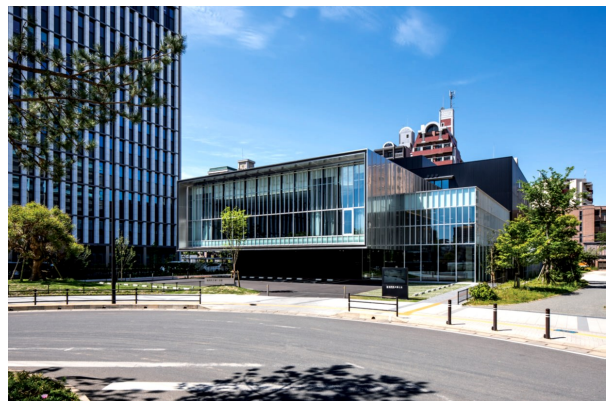
「福岡県弁護士会館」