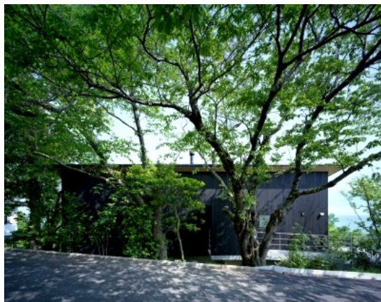
住宅の部 大賞「糸島の家(MPラボ)」