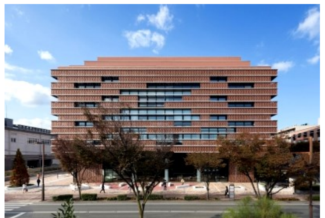
一般建築の部 大賞「西南学院大学図書館」